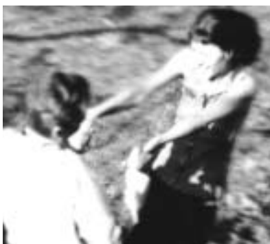
«Kirchlich heiraten – einfach und persönlich» heisst die neue Broschüre der beiden Landeskirchen. Bild: Ausschnitt aus dem Titelbild.

Das Motto «Kirchlich Heiraten – einfach und persönlich» betont nicht nur, wie einfach es ist, sich trauen zu lassen, sondern auch das Persönliche dieser Angelegenheit. Die beiden Kirchen wollen damit zum Ausdruck bringen, dass der Bund fürs Leben mehr ist als ein äusserer Akt. Vielmehr bietet die kirchliche Trauung einen geeigneten Rahmen für das, was das Paar verbindet, worauf es hofft, woran es glaubt, worin ihre Liebe gründet.