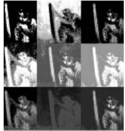
Titelbild des Flyers, gestaltet nach «David» von Rembrandt.